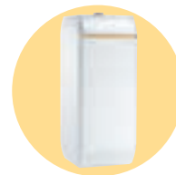
DTG 1300 Eco. NOx Plus / V 130