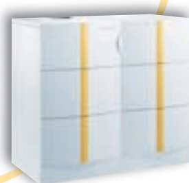
DTG 1300.35 Eco. NOx Plus BA 150

■ Er bestaan ook niet-uitgeruste versies, zodat de Elidens ook in reeds bestaande installaties kan worden geplaatst (renovatie).