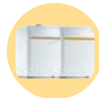
DTG 1300 / B 150 Eco. NOx Plus