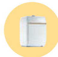
DTG 130 Eco. NOx Plus