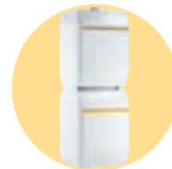
DTG 1300 / H 150 Eco. NOx Plus