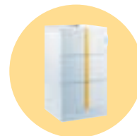
DTG 130 - 35 Eco. NOx Plus