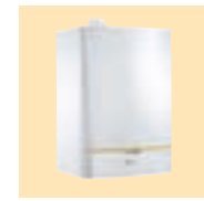
MCA 15 / 25 / 35 BS 130

Chaudière H 690 mm L 450 mm P 450 mm 34 kg Ballon H 912 mm Ø 570 mm 63 kg