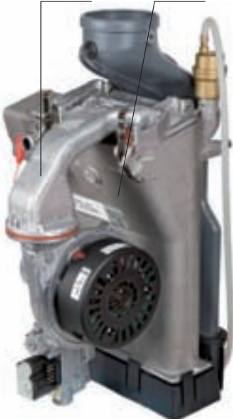
Brûleur modulant Corps de chauffe